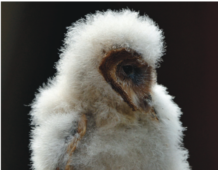
Juveniele Kerkuil

Inschrijven is verplicht via eddie.schild@scarlet.be