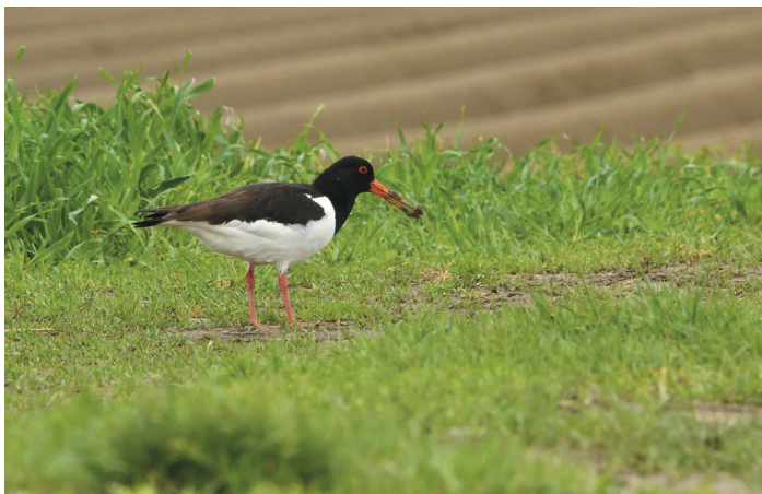
Scholekster