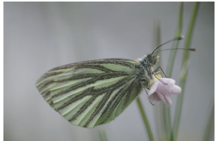
Klein geaderd witje