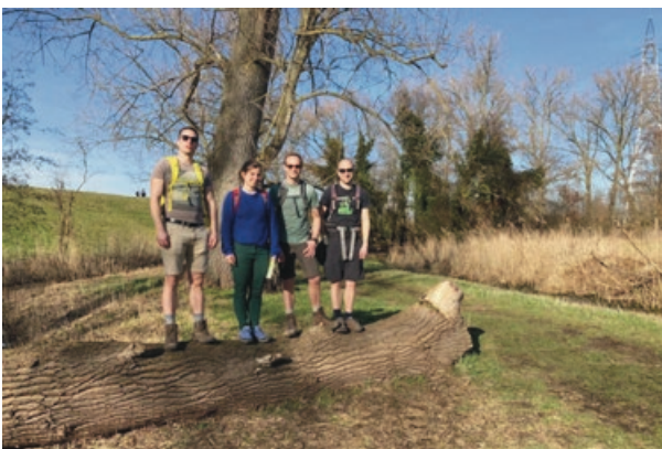
De Roekies: expeditie.natuurpunt.be/project/29357