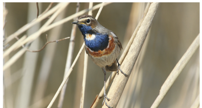
Blauwe reiger Blauwborst