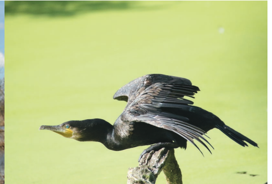
Aalscholver - foto: Eddie Schild